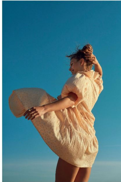
Kjole fra Stine Goya, 2.400 kr. i str. XS-XL. Ørering med blomst fra Wilhelmina Garcia hos Lot#29, 350 kr. Ear Cuff fra Maria Black, 550 kr. Ringe fra Wilhelmina Garcia hos Lot#29, 1.100 kr.