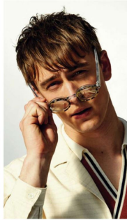
Camisa de cuadros de Mott & Mott en el estudio de Fred Perry. Pantalón de mezclilla en el estudio de Caravel 1985.