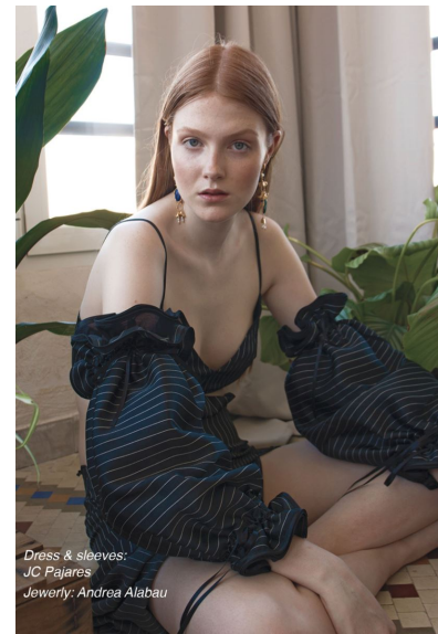
Dress & sleeves: JC Pajares Jewelry: Andrea Alabau