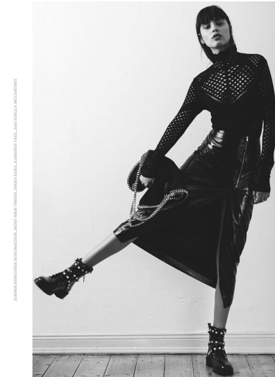
HAAR: ESTHER, MAKEUP: ESTHER, HAARE: ESTHER, MAKEUP: ESTHER