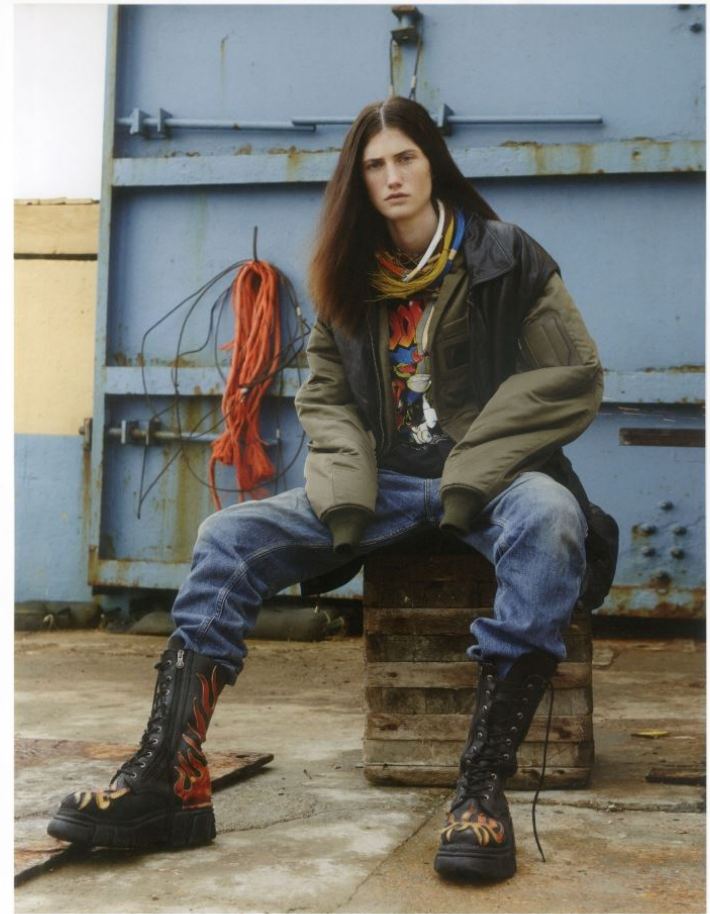
bomber: JUUN J jeans: LEVI'S boots & shirt: VINTAGE leather jacket: HARLEY DAVIDSON

GRÖSSE 179 OBERWEITE 80 TAILLE 62 HÜFTE 91 SCHUHE 41 HAARE BRAUN AUGEN BLAU