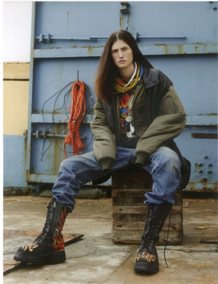
bomber: JUUN J jeans: LEVI'S boots & shirt: VINTAGE leather jacket: HARLEY DAVIDSON

GRÖSSE 179 OBERWEITE 80 TAILLE 62 HÜFTE 91 SCHUHE 41 HAARE BRAUN AUGEN BLAU