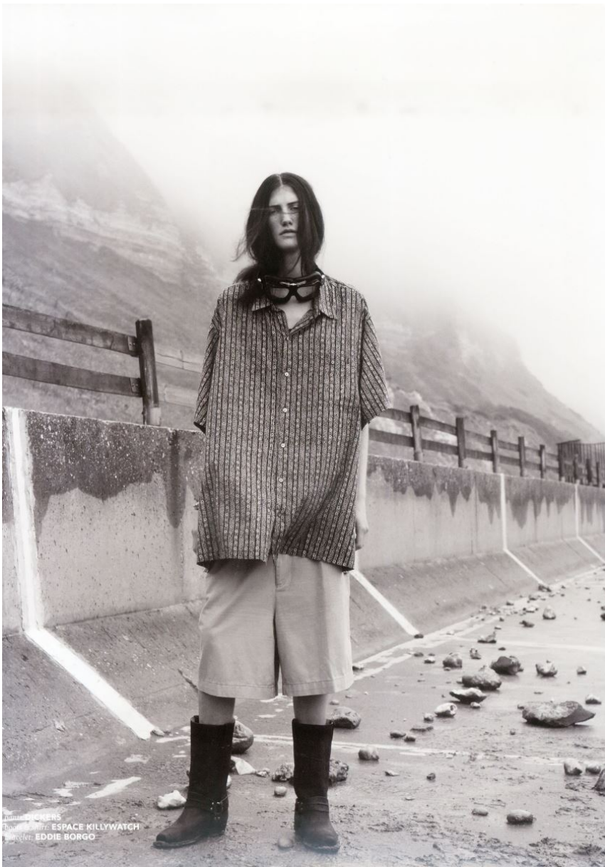
model: STICKERS stylist: EDDIE BORGIO

GRÖSSE 179 OBERWEITE 80 TAILLE 62 HÜFTE 91 SCHUHE 41 HAARE BRAUN AUGEN BLAU