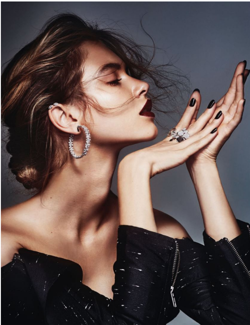
Ohrschmuck „Masterpiece“ in 18 kt Weißgold mit Diamanten in 13,75 ct von Juwelier Wagner , Ohrstecker „Salt 'n' Pepper“ in Platin mit Diamanten in 0,74 ct von Seitner Schmuckwerkstatt , Ringfinger: Ring in 18 kt Weißgold mit Navette-Diamant in Fancy Braun zu 3,72 ct und Brillanten zu 0,32 ct von A.E. Köchert , Mittelfinger: Ring „Paper Flower“ in Platin mit Clusterdiamantblüte von Tiffany & Co. , Kleid von Self-Portrait .