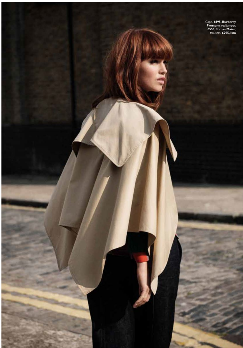
Cape, £895, Burberry Prorsum; red jumper, £555, Tomas Maier; trousers, £295, Issa