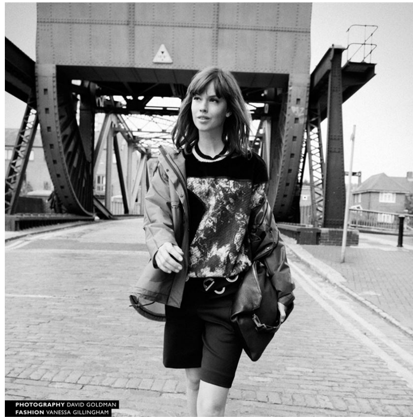
PHOTOGRAPHY DAVID GOLDMAN FASHION VANESSA GILLINGHAM