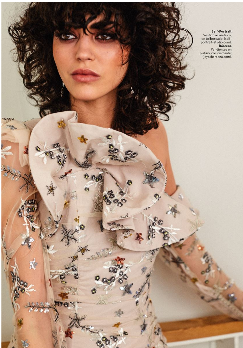
Self-Portrait Vestido asimétrico, en tul bordado; (self- portrait-studio.com). Bàrcena Pendientes en platino, con diamante; (joyasbarcelona.com).