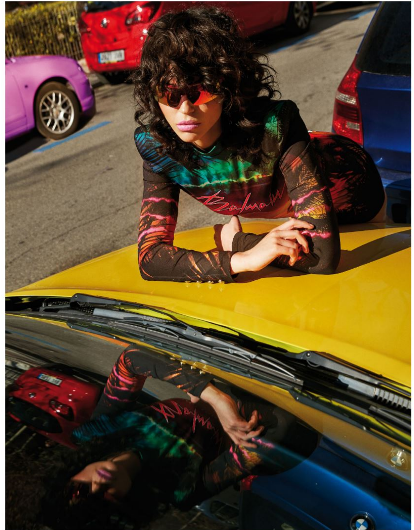
Vestido de Balmain para Elite Marbella y gafas de sol de Stella McCartney