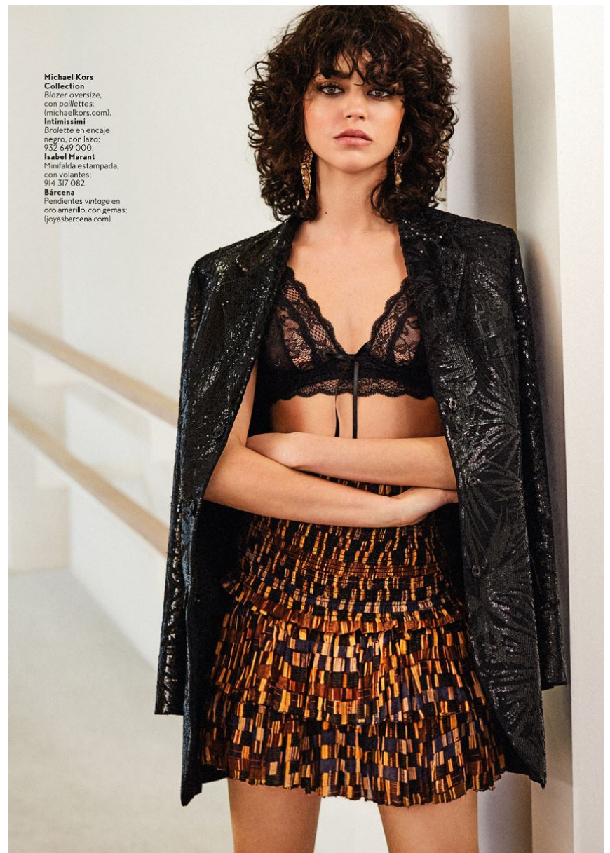
Michael Kors Collection Blazer oversize, con paillettes; (michaelkors.com). Intimissimi Bralette en encaje negro, con lazo; 932 649 000. Isabel Marant Minifalda estampada, con volantes; 914 317 082. Bàrcena Pendientes vintage en oro amarillo, con gemas; (joyasbarcelona.com).