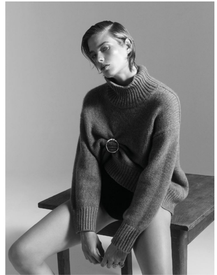
Pullover von FTC Cashmere aus der Schweiz. Strickhose von Pugnat. Ringe von Pandora. Brosche von & Other Stories.