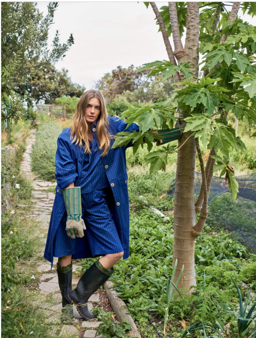
Diese Seite: Mantel, Bermudashorts und Bluse aus organischer und recycelter Baumwolle von Baum und Pferdgarten . Gartenhandschuhe und Boots: vintage. Rechts: Die Jeansjacke mit überlangen Ärmeln besteht aus Bio-Baumwolle und ist Teil der nachhaltigen Eco-Denim-Linie „A Better Blue“ von Closed . Kleid mit plissiertem Rock von Plan C . Hut: vintage.