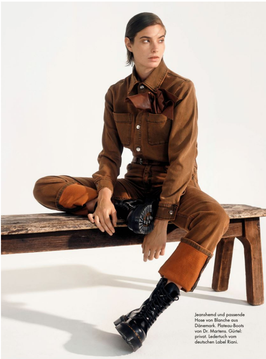
Jeanshemd und passende Hose von Blanche aus Dänemark. Plateau-Boots von Dr. Martens. Gürtel: privat. Ledertuch vom deutschen Label Riari.