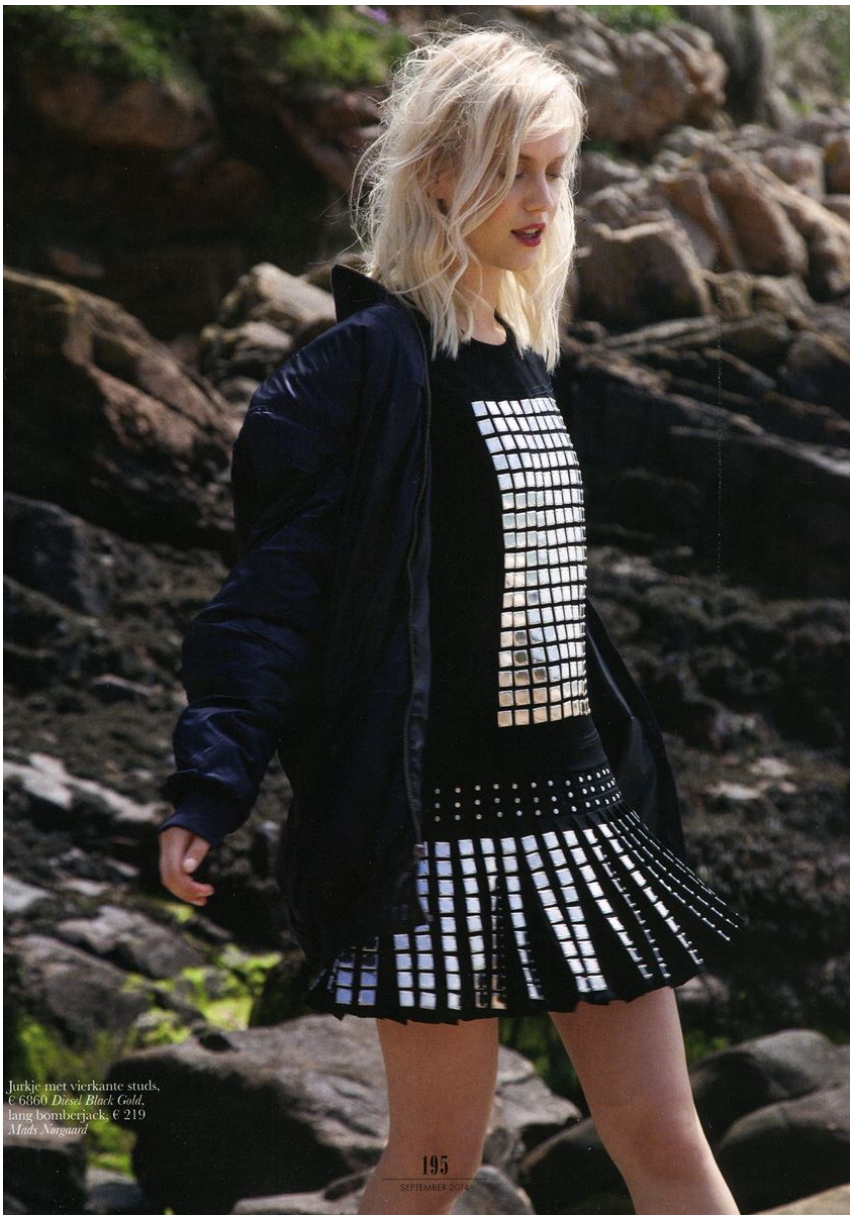
Jurkje met vierkante studs, € 6860 Diesel Black Gold, lang bomberjack, € 219 Mads Norgaard