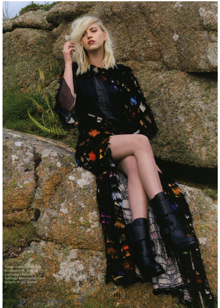
Lange organza jurk met borduurwerk, prijs op aanvraag Chalayan, hulthoge leren laarzen met gespen, € 615 Simona