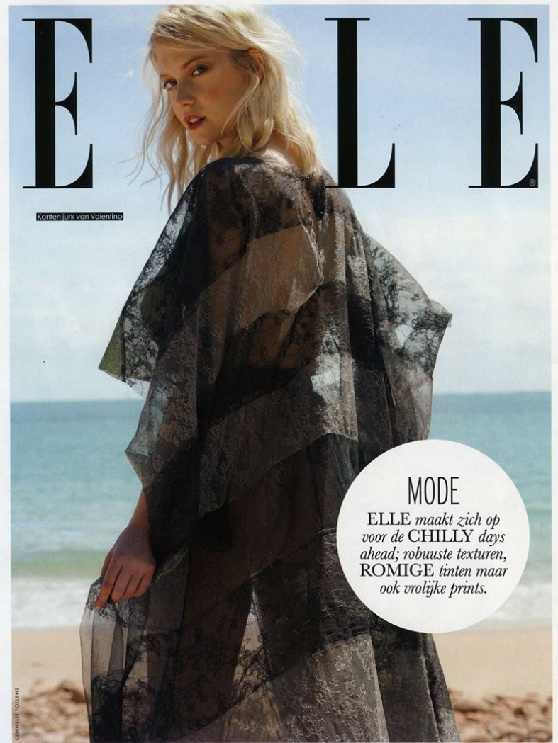
Kanten jurk van Valentino

MODE ELLE maakt zich op voor de CHILLY days ahead; robuuste texturen, ROMIGE tinten maar ook vrolijke prints.