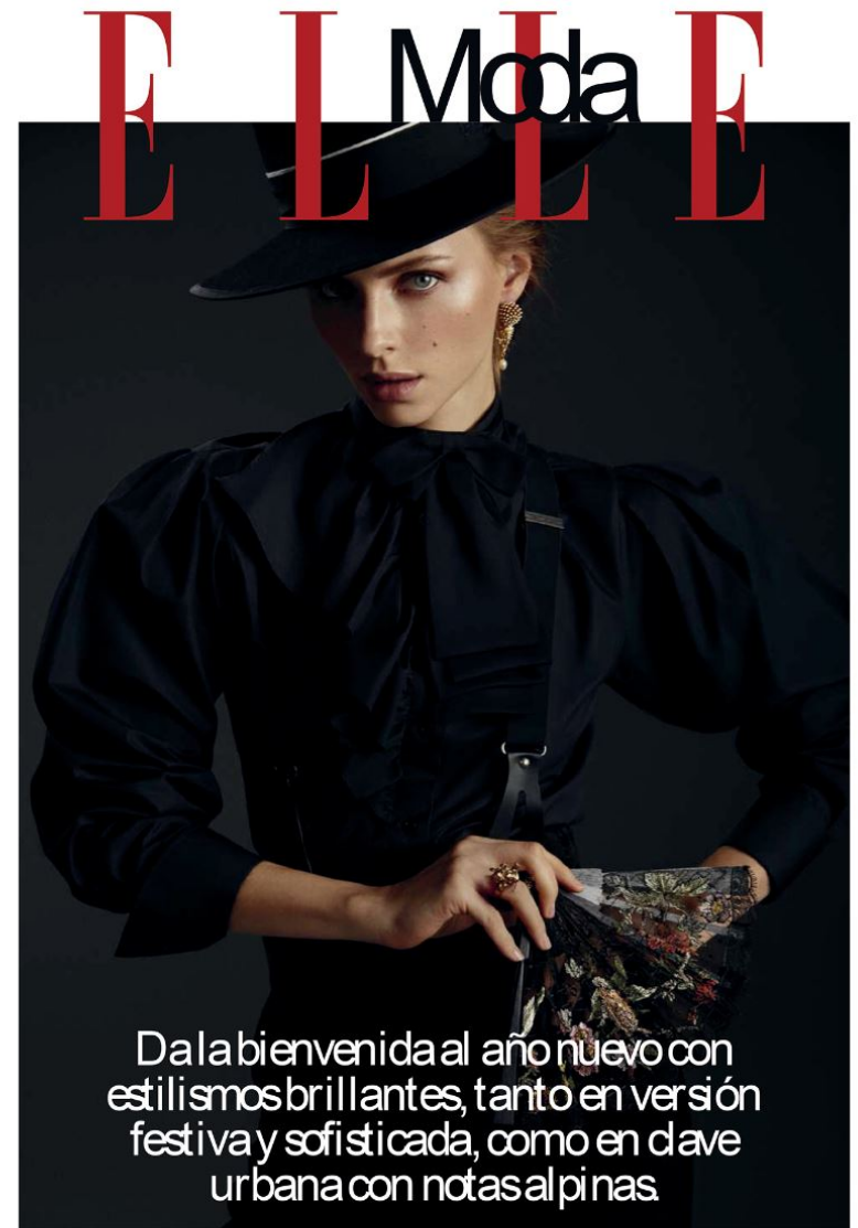
FOTO BERNA DELA LAMIA. REALIZACION: BARBARA GARRALDA Y ESTUVA MONTOLIU. BLUSA CON VOLANTES (1700 •), PANTALONISELASTICOS (2.300 •), SOMBRERO DORADO (880 •), CORBAION EN CORDON NEGRO (580 •), FABRICO DICK JAPON BOTANICO (880 •), TODO DE DOR.

Da la bienvenida al año nuevo con estilismos brillantes, tanto en versión festiva y sofisticada, como en clave urbana con notas alpinas.