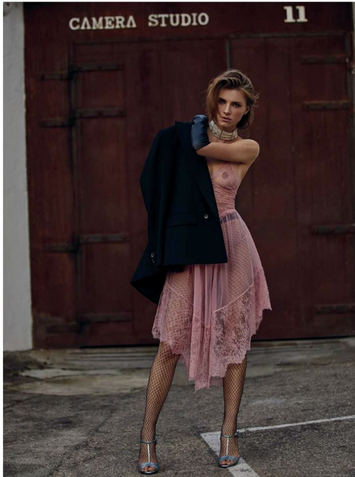
Vestido lencero en encaje con transparencias, de Gucci. Americana (89,95 •), collar de perlas (25,95 •) y guantes largos (39,95 •), todo de Zara. Medias de rejilla (9,95 •), de Calzedonia. Sandalias 'Amore Mio' con cristales (1,095 •), de Aquazzura.