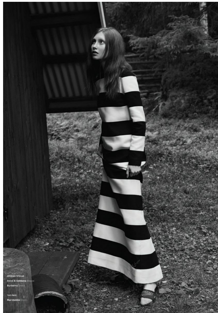
OPENING SPREAD Dolce & Gabbana Blouse Burberry Dress