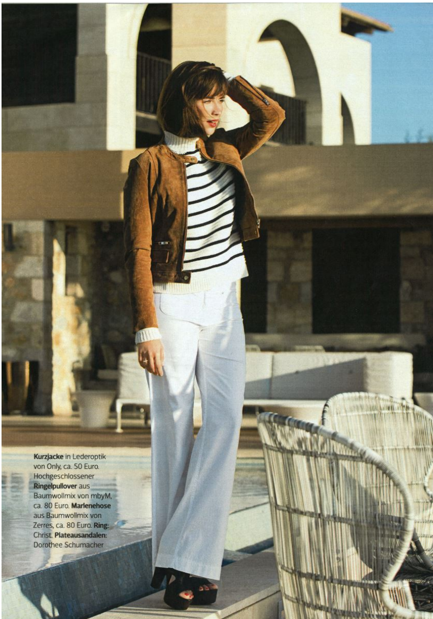
Kurzjacke in Lederoptik von Only, ca. 50 Euro. Hochgeschlossener Ringelpullover aus Baumwollmix von mbyM, ca. 80 Euro. Marlenehose aus Baumwollmix von Zerres, ca. 80 Euro. Ring: Christ. Plateausandalen: Dorothee Schumacher