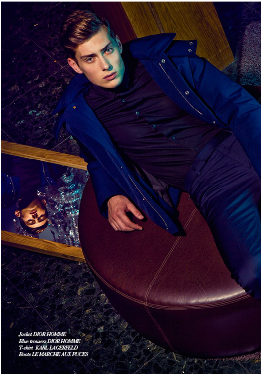
Jacket DIOR HOMME Blue trousers DIOR HOMME T-shirt KARL LAGERFELD Boots LE MARCHE AUX PUCES