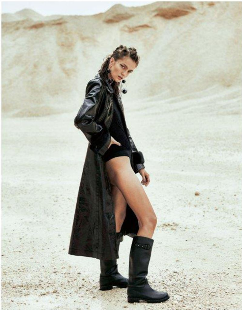
Cappotto di pelle con bordi in visone (Fendi) su body (Guess Underwear, € 69,90). Orecchini (Marni), stivali con cinturino (Ermanno Scervino, € 930).