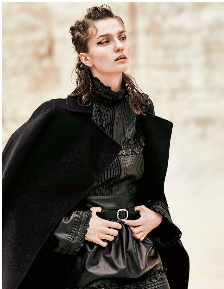
M axicappotto in lana doppiata con cintura (Herno, €1.320) su abito in pelle con pieghe e profili traforati effetto pizzo (Dsquared2).