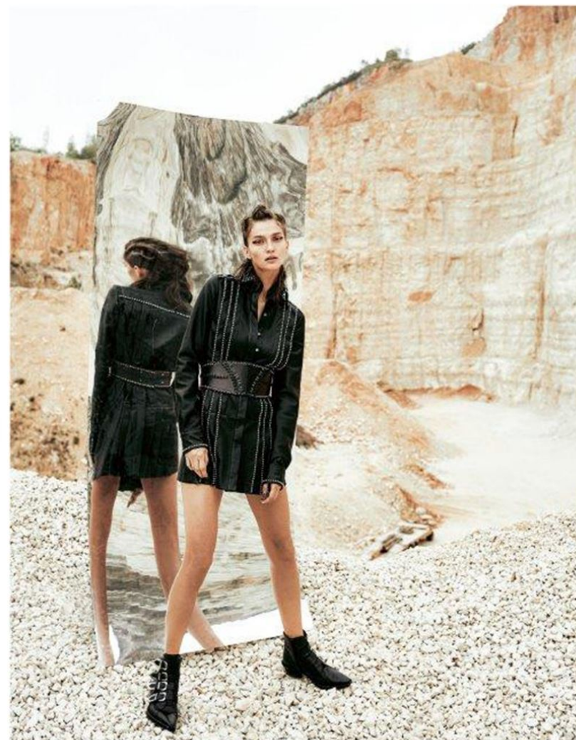
A bito in pelle con microbarchie più cintura-bustino (tutto Fay). Stivaletti a punta con fibbie in metallo (Versus, € 650 ca.). Il servizio è stato realizzato presso le Cave di Virle, in provincia di Brescia.