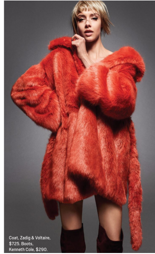
Coat, Zadig & Voltaire, $725. Boots, Kenneth Cole, $290.