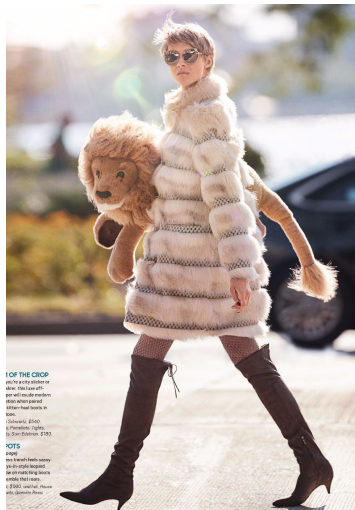
FOR THE DROP The fur coat is the easiest way to get all the cozy without the ethical issues. The lion plush is from the brand's collection.