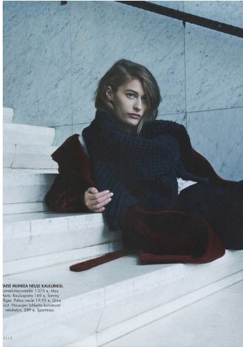
DIANE VON FURSTBERG KASIKKINEN. Sormukset: KASIKKINEN. Alex: KASIKKINEN. Fifi: KASIKKINEN. Rigel: KASIKKINEN. 19: KASIKKINEN. Giara: KASIKKINEN. Lohikäärme: KASIKKINEN. Käärme: KASIKKINEN. 200: KASIKKINEN.