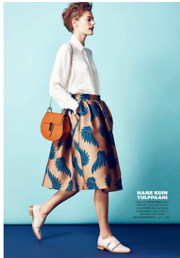
HAME KUUN TULPPAANI