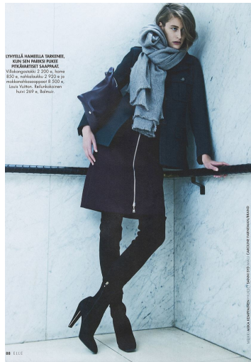
TYHYLLÄ HAMMILLA TAKKINEE, KUN SIÄÄ PÄÄSIÄ SIIEDE PIKKIKÄRTTÄ SAAPPAAT. Vihreäpöytä 2 200 € ja haina 850 €, nahkakukka 2 920 € ja mokkanahkainkorppe 8 920 €. Laina Naitto, Ruukkiokosen hana 200 €. Seinen.