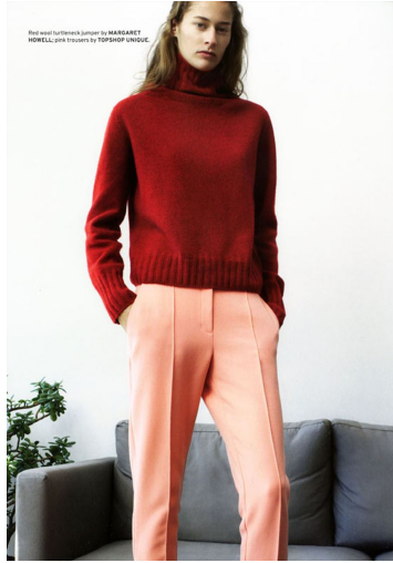
Red wool turtleneck jumper by MARGARET HOWELL, pair trousers by TOPSHOP UNITED.