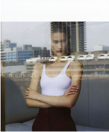
This page: burgundy wide-leg wool trousers by ANTONIO BERARDI. Opposite: black wool dress with leather detail by MAXMARA, patent burgundy boots by MATSON MARTIN MARGIELA.