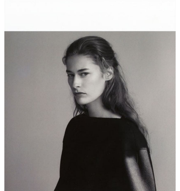
This page: navy and electric blue A-line top, dark chocolate trousers, both by VICTORIA BECKHAM. Opposite: navy wool jumper, navy wool skirt, both by CELINE, white roll-neck body (worn underneath) by FENDI.