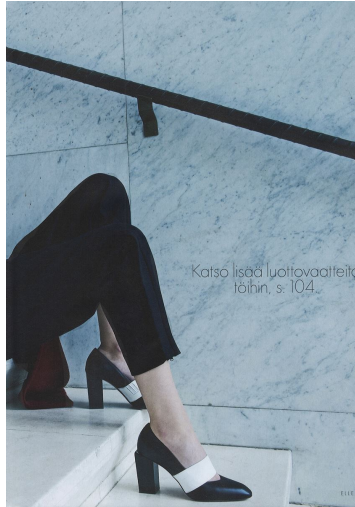
Katso lisää luotettavaa tietoa löihin, s. 104