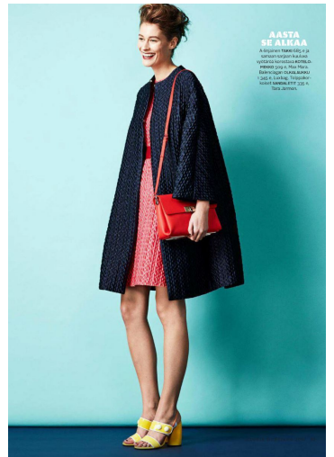
AASTA SE ALLEIA