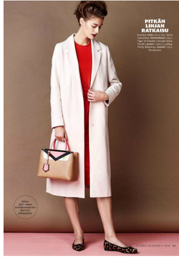
PITKÄN LINJAN RATKAISU