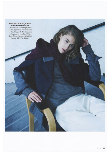
VALKOISET HOUSUT SOPIAT MYÖS KUUNNINNA. Kaksiosainen viikotyttö 774 €, Spennin Pöytäpöytä 150 €, Filippi K. Neulapöytä 100 €, Kokoelma 100 €, Gina Tuija, Kokoelma 100 €, hana 40 €, TAA.