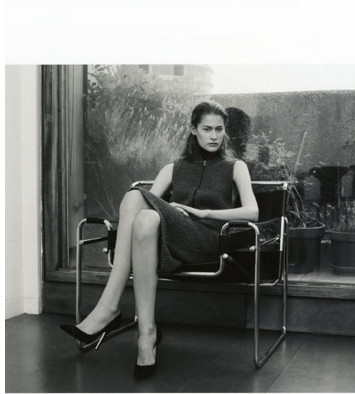
This page: light grey rib-knit wool dress with zip front by MARCONI MARTIN MARGIELA, black roller (worn underneath) by PROENZA SCHOUER. Opposite: teal ribbed knitted jumper by A&CIE, black mid-heel by ROCHAS.