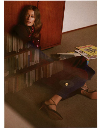
WRITING TOP AND TROUSERS BY TARA SHERIDAN.