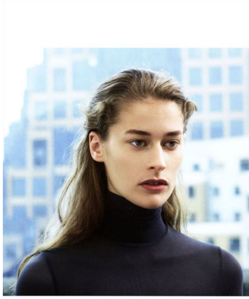
Je grey roll neck top by MOLFORD. Open-fer black and white zig zag dress with bow back, also both by PROENZA SCHOUER. Black trousers (shown underneath) by ACNE.