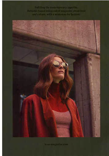
Fulfilling the contemporary appetite, Helsinki-based independent magazine about food and culture, with a weakness for fashion.